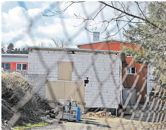
Co s ní? O tom, jak se k černé stavbě v Rantířově postaví, bude rozhodovat jihlavský stavební úřad.

Proč společnost začala stavět i s rizikem vysoké pokuty? Vysvětlení ze strany firmy lze zjednodušeně tlumočit takto: Protože obec Rantířov prý protahovala projednání stavby, rozhodla se firma mezitím již dodanou novou technologií zastřešit -